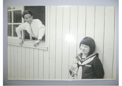
学校生活のひとこま