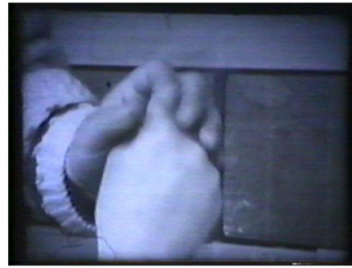
指文字による交信