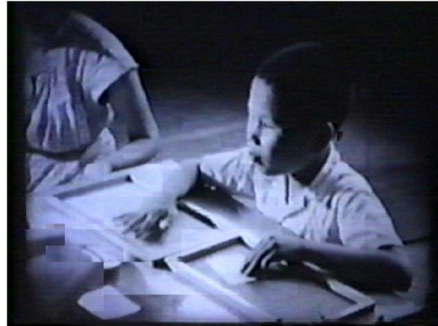
点字と実物の一致